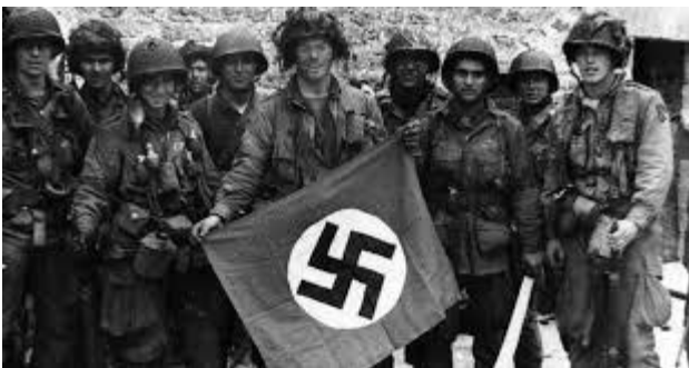
La creación de grupos políticos radicales como el nazismo, es una consecuencia de las ideologías.